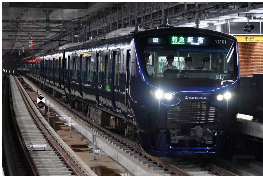
相鉄・JR直通線用の新型車両「12000系」