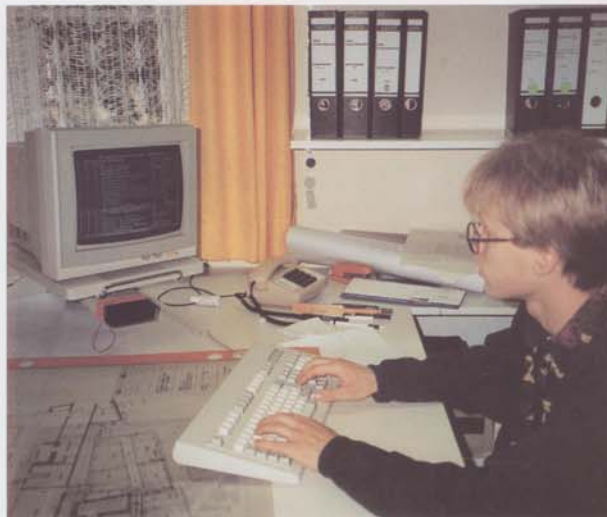
Durch den Einsatz der SSS-Software werden beste Voraussetzungen für eine termingerechte Ausführung der Installationen geschaffen. So wird laut leicht, Mitarbeiter vom Ing.-Büro Müller, auch das Arvena-Hotel termingerecht eröffnet werden können.