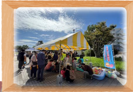
「ふれあい広場鈴鹿」当日の様子

このたびは、「ふれあい広場鈴鹿」の開催にあたり、たくさんのボランティアさんのご協力をありがとうございました。当日はお天気に恵まれ、たくさんの方に参加していただき、無事にイベントを終えることができました。今後とも「ふれあい広場鈴鹿」の開催を通じて、地域交流と福祉の輪を広げていけるようにと考えておりますので、今後とも、ご理解ご協力いただきますようお願い申し上げます。