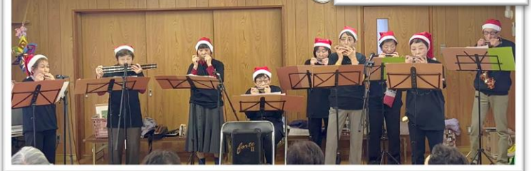
サロンでのボランティア活動の様子