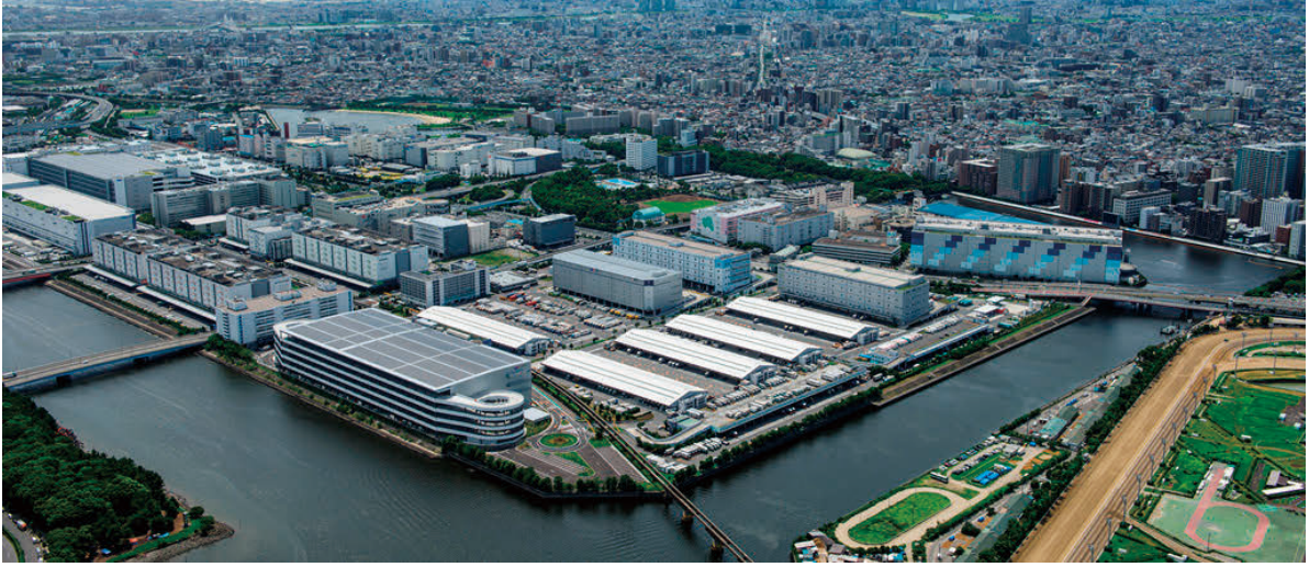
南部流通業務団地