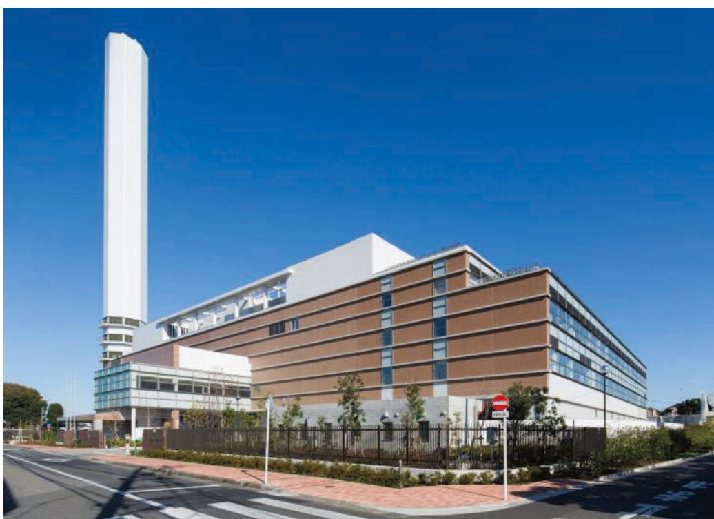
(練馬清掃工場 23 区清掃一部事務組合 HP より)

多摩・島しょ地区においては、八王子市の北野清掃工場をはじめとして、ごみ焼却場 25 か所、ごみ処理場 23 か所及び汚物処理場 12 か所が都市計画決定されています。