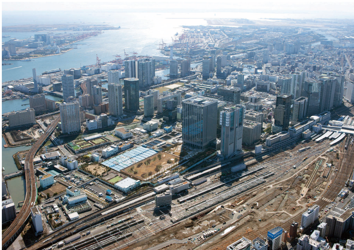
芝浦水再生センター