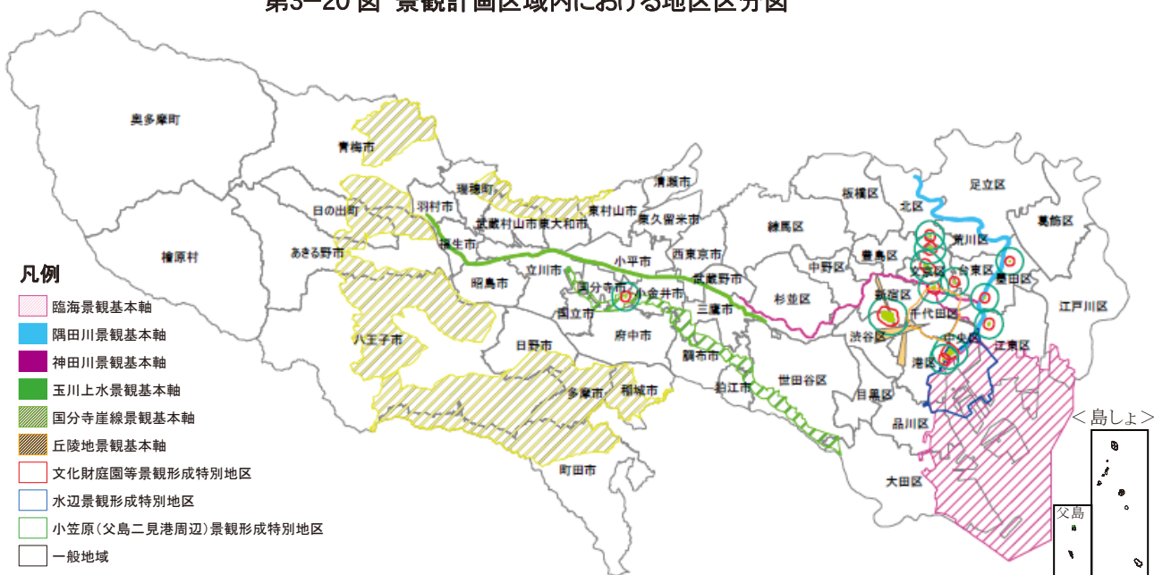
第3-20 図 景観計画区域内における地区区分図