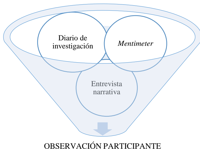
Figura 2. Método e instrumentos de recogida de información.

Durante el desarrollo de las clases, se registra todo aquello considerado como relevante, significativo o anecdótico para la investigación según los estudios científicos y teóricos previos (Hammersley y Atkinson, 1994), generando así, un proceso de selección de los datos (Álvarez, 2011). De esta manera, se inicia desde el principio una interpretación de los datos (Simons, 2011) al mismo tiempo que su codificación y comparación. Junto con el diario de investigación, al final de cada sesión se realizaba una actividad a través de la aplicación Mentimeter , por la que se les pedía a los estudiantes que reflejaran su valoración sobre el uso de esta metodología y de las redes sociales. La información recogida a través de la aplicación Mentimeter complementa y contrasta los datos del diario de investigación. Las entrevistas narrativas, abiertas, en las que los estudiantes relataban sus vivencias sin un guion previo, han permitido además profundizar en las percepciones de los estudiantes.