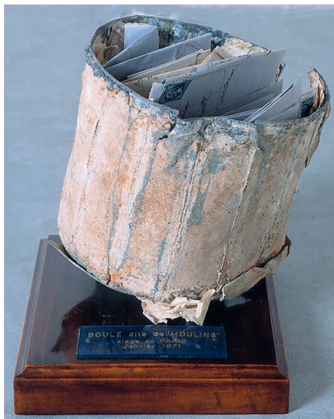
Boule de Moulins, retrouvée en 1968.

Im Jahr 1968 gefundene «Boule de Moulins».