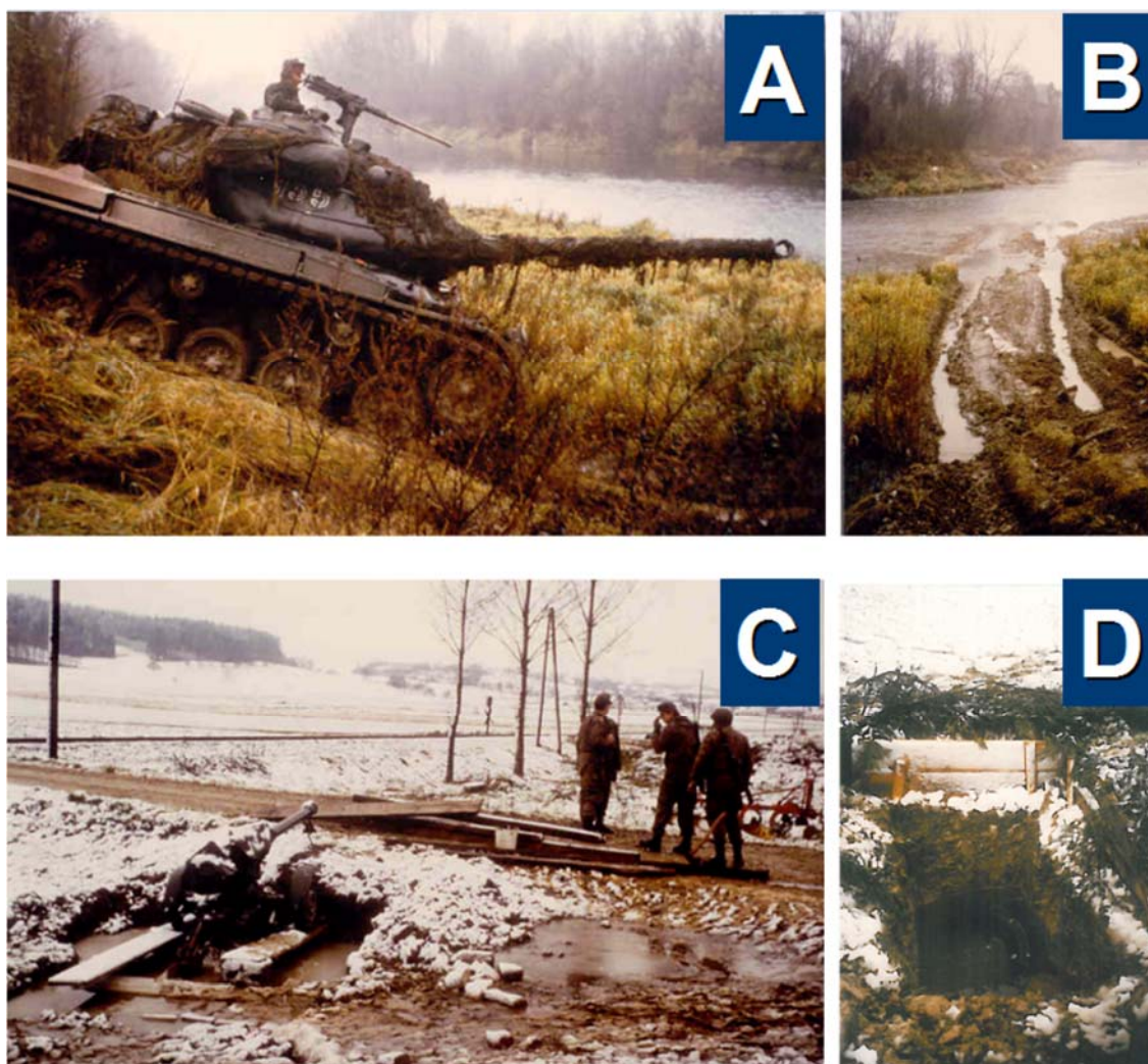
Abb. 5: Kampfpanzer M 60-A1 vor den Furten der Erlauf südlich Kendl (A). Ein Anlanden gepanzerter Fahrzeuge am durchnässten Ufer der hier noch Niederwasser führenden(!) Erlauf war ohne technische Hilfsmittel kaum möglich (Aufsitzen der Wanne; B). In den Tagwasser-vergleyten Böden konnten weder Stellungen der rückstoßfreien Panzerabwehrkanone (C) noch Schützenstellungen wirksam angelegt werden (D).