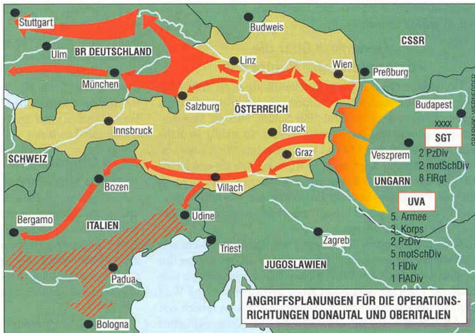
Abb. 1: In der Zeit des Kalten Krieges wurde von den Truppen der Ungarischen Volksarmee (UVA) ein Durchstoß entlang des Donauraumes Richtung Bundesrepublik Deutschland vorbereitet (BALLÓ, 1998).

Diesen Umständen trugen schließlich die Bundesheerreform 1972 und das damalige Konzept der Raumverteidigung Rechnung. In diesem Konzept wurde das Bundesgebiet in Schlüsselzonen und Raumsicherungszonen aufgeteilt, wobei die Schlüsselzonen als Hauptkampfbzonen festgelegt wurden, in denen eine Verzögerung eines Angriffes und eine zeitlich begrenzte Verteidigung in Anlehnung an verbunkerte feste Anlagen vorgesehen war. Im niederösterreichischen Zentralraum bildeten die Erlaufstellungen das Zentrum der Schlüsselzone 35 (SZ 35). Das östliche Vorland zählte zur Raumsicherungszone 36 (RSZ 36). Gemäß den Angaben des ungarischen Staboffiziers Oberstleutnant Dr. István BALLÓ (Abb. 1) war die „Operative Richtung Donautal“ jenes Kriegsszenario des Warschauer Paktes, das die Ungarische Volksarmee zu planen und vorzubereiten hatte.