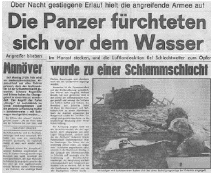
Abb. 3: Berichte einer Tageszeitung über den Manöververlauf vom 19. bis 22. November 1979. Wegen der anhaltenden Schnee- und Regenfälle wurde das Manöver zu einer „Schlamm Schlacht“, geplante Luftlandungen mussten wegen der schlechten Wetterlage abgesagt werden.

die strenge Disziplin und das klare Bewusstsein der Aufgaben, die durch Nässe, Schneefall und Kälte nicht beeinträchtigt worden sind (Abb. 3). Dazu ist letztlich anzumerken, dass in einem Ernstfall die Panzergrenadierbrigaden der Partei „Orange“ die mechanisierten Hauptkräfte im Kampf um die SZ 35 gebildet hätten.