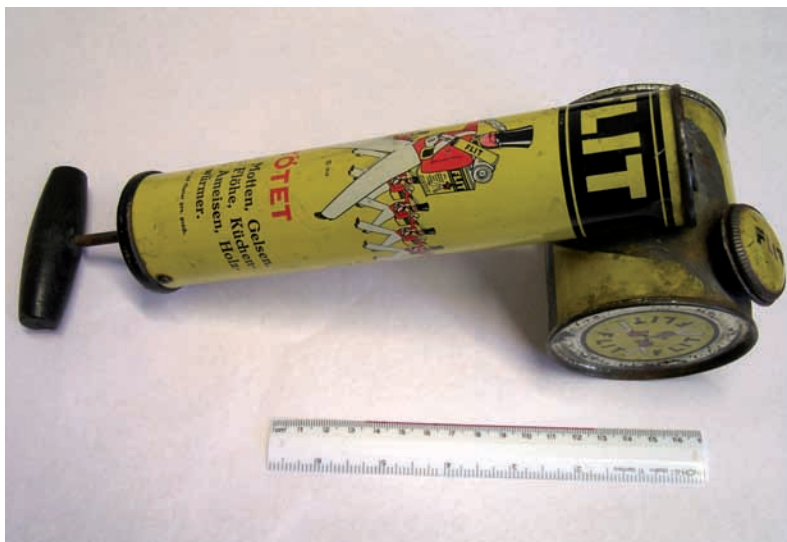
Abb. 9: Flit-Spritze, Historischer Kaufmannsladen Spitz an der Donau.

In Österreich existieren derzeit 36 dieser Ameisen-Sparvereine, Niederösterreich selbst zählt mit Stand vom September des Jahres 2008 genau 15 Sparvereine, wobei sich derjenige von Dietersdorf im Bezirk Tulln 2006 in die „Sparvereinigung Ameise“ umbenannte.