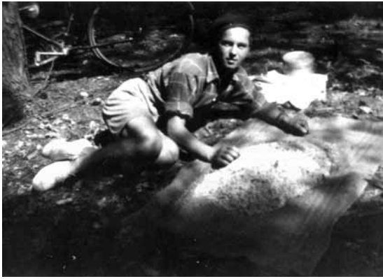
Abb. 2: Aufschüttung des Sammelgutes (8 Liter) im Karnabrunner Wald, datiert 1950, Privatbesitz.

suchte man sich Haufen in der nahen „Gstetten“. Zum Abtransport verwendete man die Aluminium-Brot Dosen oder Aufbewahrungsdosen der Nachkriegszeit, wie sie auch auf einem Foto, das 1950 in Karnabrunn aufgenommen worden war, zu sehen sind (Abb. 2). Zu Hause wurden die Puppen in der Sonne in einem selbstgefertigten Rahmen, der mit einem dünnen Leinenstoff bespannt war, getrocknet; heute wird dieser zum Trocknen von gesammelten Pflanzen verwendet (R).