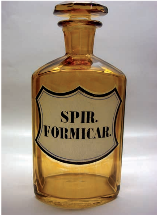
Abb. 5: Apotheken- Standflasche mit Signatur SPIR. FORMICAR. (Ameisenspiritus) um 1880, Landschafts- Apotheke Horn.

Die Ameiseneier wurden demnach zur Herstellung von Aqua acoustica und Essentia acoustica verwendet. Sie „taugen zum üblen Gehör“, ebenso der in Baumwolle getränkte Ameisengeist. Er ist auch für den Magen gut, stärkt alle Sinne und das Gedächtnis, macht die „feigen Kämpfer im Venus-Kriege behertzt“ und wird als schlag- und herzstärkendes Wasser genommen, vornehmlich in „Catarrhis suffocativis“. Die Dosis ist ein Löffel. Äußerlich wird er gegen das laufende Zipperlein angewendet, in „verdreheten Gliedern“, im „Schlage und Atrophia particulari, so von einer empfangenen Wunden entstanden.“ 1729 diente der Ameisengeist vermischt zur Essentia aphrodisiaca, 1908 nur mehr als Antirheumaticum. Das Ameisenöl „tauget zum Bey-schlaffen“, der Spiritus aber ist besser dazu. Beim aus dem Ameisenhaufen destillierten Ameisengeist ist keine direkte Indikation angegeben, doch ist die rheumatische Anwendung wahrscheinlich (WINKLER 1908: S. 14f).