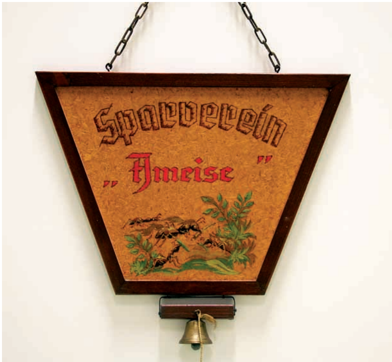
Abb. 10: Tischzeichen, Sparverein Ameise, Niederrußbach.

den. Demnach gibt es bei 20 Gemeinden (und 35 Orten) an die 60 Sparvereine, was einen Durchschnitt von 3 Sparvereinen pro Gemeinde bedeuten würde. Drei von diesen insgesamt 60 Vereinen tragen den Namen Biene und zwei den Namen Ameise in ihrer offiziellen Vereinsbezeichnung (BÄ).