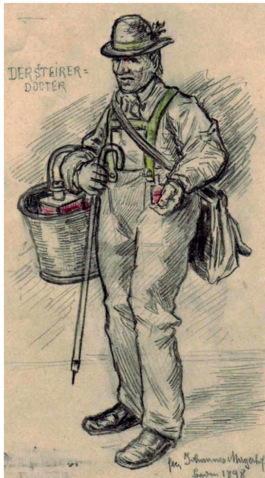
Abb. 6: Der Steirer Doctor, im Ill. Wiener Extrabl. 1898 als „Amasdoctor“ bezeichnet; Zeichnung Johannes Mayerhofer, datiert 1898, Rollett-Museum Baden.

Nicht nur um die Krankheitsableitung allein geht es bei der Empfehlung, seinen eigenen Harn bei Gelbsucht vor Sonnenaufgang in einen Ameisenhaufen zu lassen