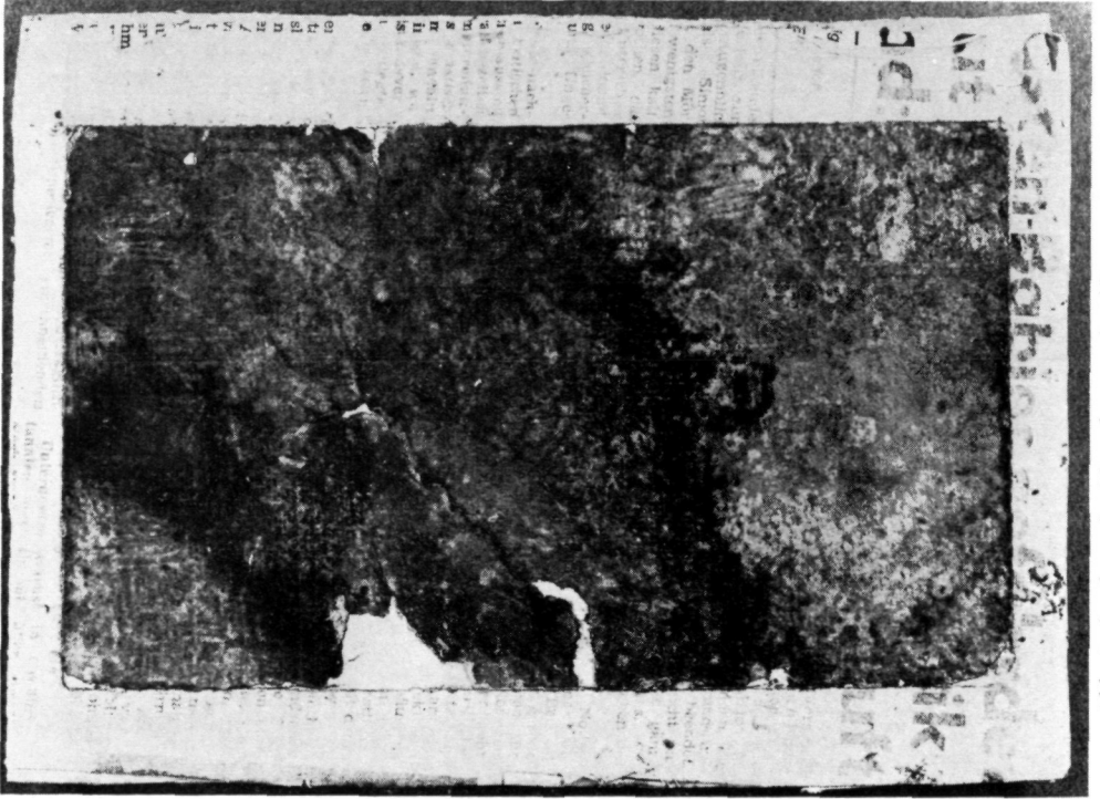
Abb. 3: Struktur der Unterlage nach Ablösung des Bildes.