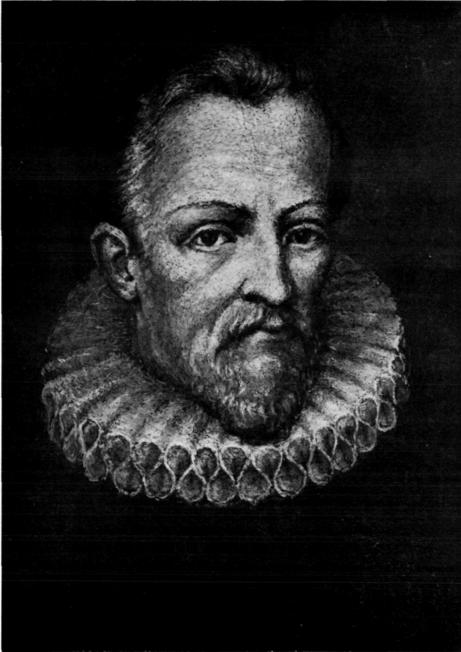
Abb. 1: Das Ölbild Johannes Keplers nach der Restaurierung.