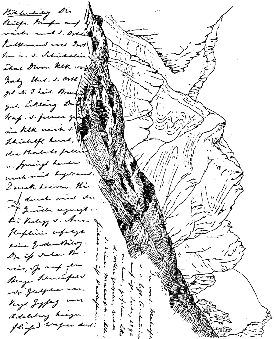
Abb. 4: Skizze des Faltenbaues im Ortlergebiet aus dem Kartierungsheft Nr. 4 von Eduard SUESS vom 28. August 1875 als Beispiel für seine Zeichentechnik tektonischer Strukturen.