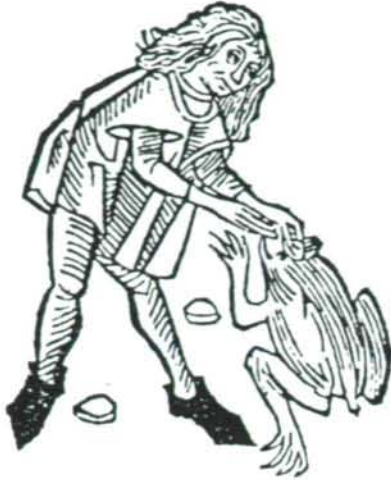
Abb. 5: Das Entnehmen des „Krötensteines“. Holzschnitt-Illustration aus dem „Hortus Sanitatis“.

Längere Abhandlungen finden sich in vielen medizinischen und pharmazeutischen Werken des 16. - 18. Jahrhunderts über die sogenannten „ Krötensteine “, die vor allem in der Volksmedizin eine große Rolle spielten. Zwei Hauptarten von Krötensteinen wurden unterschieden: jene, die sich angeblich im Kopf bestimmter Krötenarten finden sollen und andere, die als fossile Seeigel oder Backenzähne von Fischen gelten.