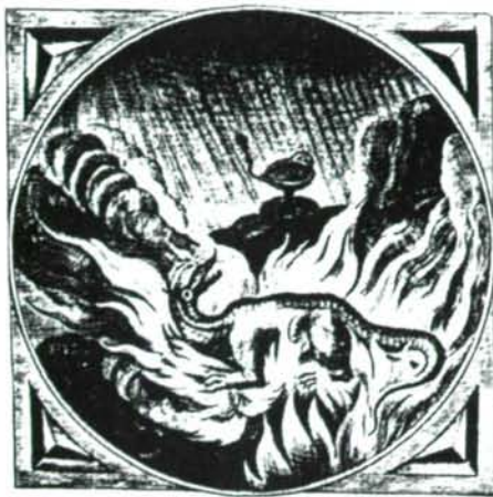
Abb. 7: Salamander im Feuer. Illustration aus einem Werk des 17. Jahrhunderts.

„Das gräßlichste von allen Thieren ist der Salamander. Die anderen beißen doch wenigstens nur Einzelne, und tödten nicht Viele auf einmal, wobei ich noch den Umstand übergehe, daß sie, wenn sie einen Menschen umgebracht haben, so heftig vom bösen Gewissen gefoltert werden, daß sie selbst sterben; der Salamander aber kann ganze Völker morden, ohne daß man merkt, woher das Unheil kommt. Kriecht er auf einen Baum, so werden allen Früchte daran vergiftet, und wer davon ißt, der stirbt unter Frostschauer, als hätte er Schierling genossen. Berührt der Salamander auch nur mit dem Fuße ein Blech, auf welchem Brot gebacken wird, so ist das Brod Gift; fällt er in einen Brunnen, so ist das Wasser Gift. Berührt sein Geifer irgend einen Theil des Körpers, und wär's auch nur die Zehenspitze, so fallen alle Haare am ganzen Körper aus. Nichts desto weniger wird dieses greuliche Ungeheuer von manchen Thieren, z.B. den Schweinen, gefressen, denn jedes Geschöpf hat seine Feinde. Die Magier behaupten, er könne Feuersbrünste löschen; es ist aber nicht wahr, denn sonst müßte man's in Rom auch bemerkt haben.“