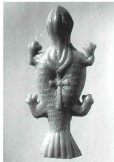
Abb. 4: Votivkröte aus Wachs. OÖ. Landesmuseum.

Vorzeichen betrachtet und eine Kröte in der Stube bedeutet überhaupt Unglück. Besonders zu Silvester kommt der Kröte im Hause besondere Orakelfunktion zu, sie soll anzeigen, daß im folgenden Jahr ein Mitglied der Familie stirbt. Weil Kröten deshalb im Hause und vor allem im Stall nicht gerne gesehen wurden, gab es traditionelle Termine im Brauchtumskalender zur Entfernung allfällig vorhandener Tiere: an Petri Stuhlfeier (22. Februar) wurden sie zusammen mit anderen Lurchen und Schlangen „ausgeklopft“ oder am Karsamstag durch ähnliches Lärmen vom Hause ferngehalten. Ab Maria Himmelfahrt (15. August) verlieren die giftigen Tiere ihr Gift – so auch die Kröten – und können deshalb leicht eingefangen werden. Man spießte sie an Gerten und hängte sie in den Ställen auf, damit sie das dort allenfalls vorhandene Gift an sich ziehen.