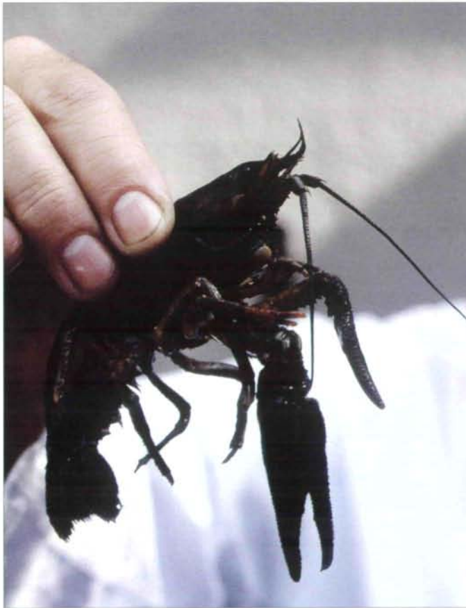
Abb. 2: Edelkrebs ( Astacus astacus ) mit schlaff herabhängenden Scheren infolge einer Krebspestinfektion.

Der Zeitpunkt des Todes nach Infektion kann variieren und hängt sowohl von der Sporenkonzentration als auch von der Wassertemperatur ab. Bei Infektionsversuchen mit einem süddeutschen Isolat von A. astaci starben juvenile Krebse bei einer Sporenkonzentration von 100 Sporen pro ml Wasser im Mittel nach 8 Tagen (Wassertemperatur 20 bzw. 15°C), bzw. 16 Tagen (10°C) (SCHMID 1998).