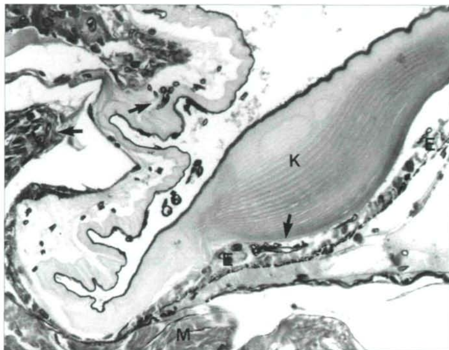
Abb. 3: Schnitt im Bereich einer Abdominalfurche zwischen zwei Abdominalsegmenten. Anschnitte von Pilzhypen (Pfeile) in der Kutikula (K), zahlreiche Hyphen in der Epidermiszelle (E) sowie beginnende Infiltration angrenzenden Bindegewebes (B) und Muskulatur (M); Grocott, 300 x.

die Sporen beim Aufsuchen eines neuen Wirtes, da sie an Pflanzenteilen hängen bleiben können. Eine starke Wasserbewegung verkürzt durch mechanische Schädigung die Überlebenszeit der Sporen; somit können eine Staustufe oder Turbulenzen im Wasser die Sporenkonzentration verringern.