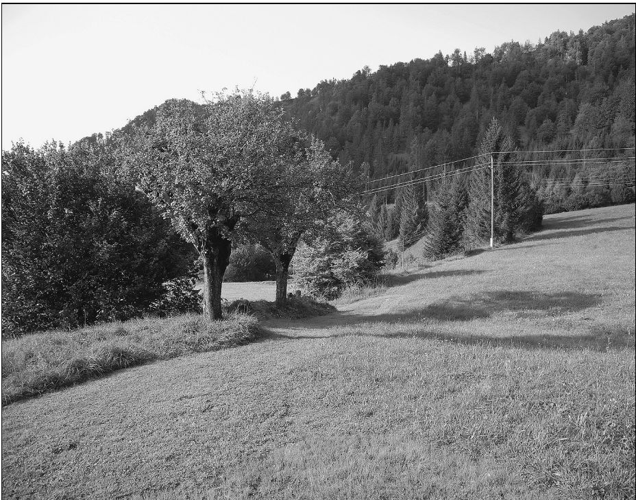
Abb. 3: Lebensraum des Wendehalses ( Jynx torquilla ) in Molln-Jaidhaus 2012. Die Bruthöhle befand sich im größeren der beiden Apfelbäume.

2012 in Untermaselsdorf/St. Thomas am Blasenstein (610 m) (F. Kloibhofer), in Waldhausen (468 m) (H. Leitner) und in Elz/Lasberg (648 m) (H. Kurz).