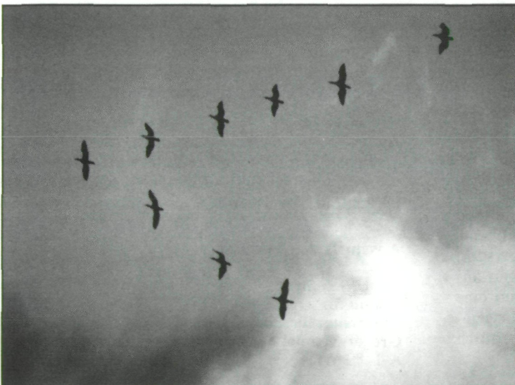
Ziehende Kormorane