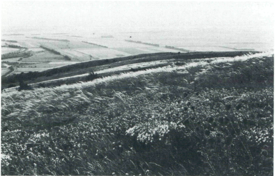
Abb.2: Vorwiegend primärer Trockenrasen mit Federgras ( Stipa eriocalis ), Hainburger Federnelke ( Dianthus Lumnitzeri ) und Wundklee ( Anthyllis vulgaris ); rechts Nickende Kratzdistel ( Carduus nutans ).