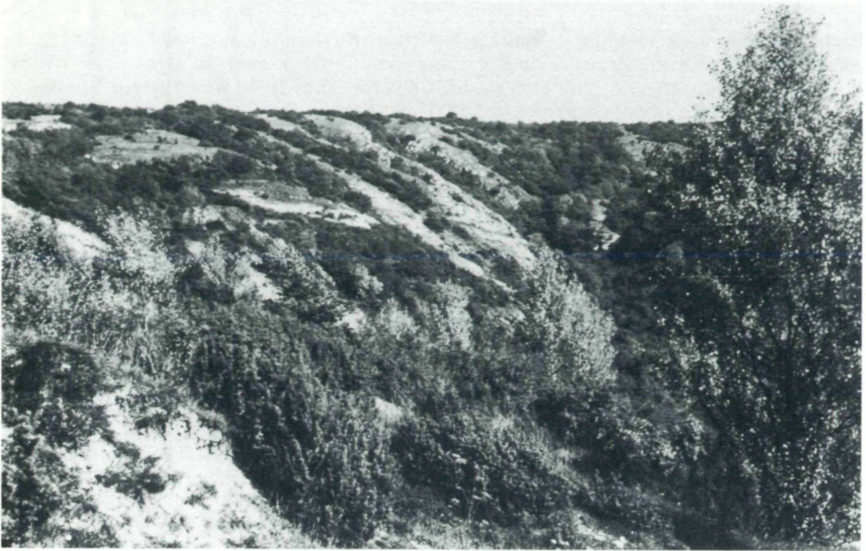
Abb.1: Südseite des zum Reservat gehörenden Einschnittes zwischen Pfaffen- und Hundsheimer Berg. Im Vordergrund Wacholder ( Juniperus communis ) und Schwarzpappel ( Populus nigra ).