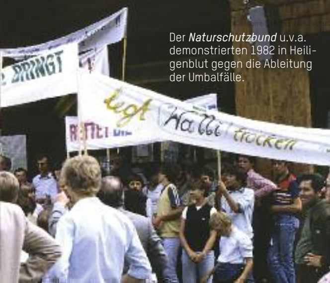
Der Naturschutzbund u.v.a. demonstrierten 1982 in Heiligenblut gegen die Ableitung der Umbalfälle.