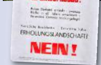
Protestplakat 1973: Beginn der Auseinandersetzung um das Großkraftwerk Dorfertal-Matrei

Ältere Pläne, im Dorfertal bei Kals in Osttirol einen Speicher für ein Großkraftwerk zu errichten, wurden gegen Ende der 1960er Jahre erneut aufgegriffen. Das Bild ist ungefähr vom Standpunkt der westseitigen Mauerkrone gegen Norden aufgenommen. Die Dorfertalpe wäre beim Bau des Speichers überstaut worden.